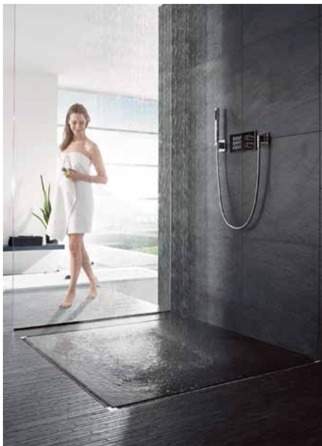
Izdelava po meri brez posebnega naročanja – v kotni izvedbi ali dolžine do 2,80 m: novi spojni elementi razširijo paleto proizvodov Advantix Vario podjetja Viega in omogočajo estetsko privlačne rešitve odvoda z veliko svobodo pri oblikovanju.